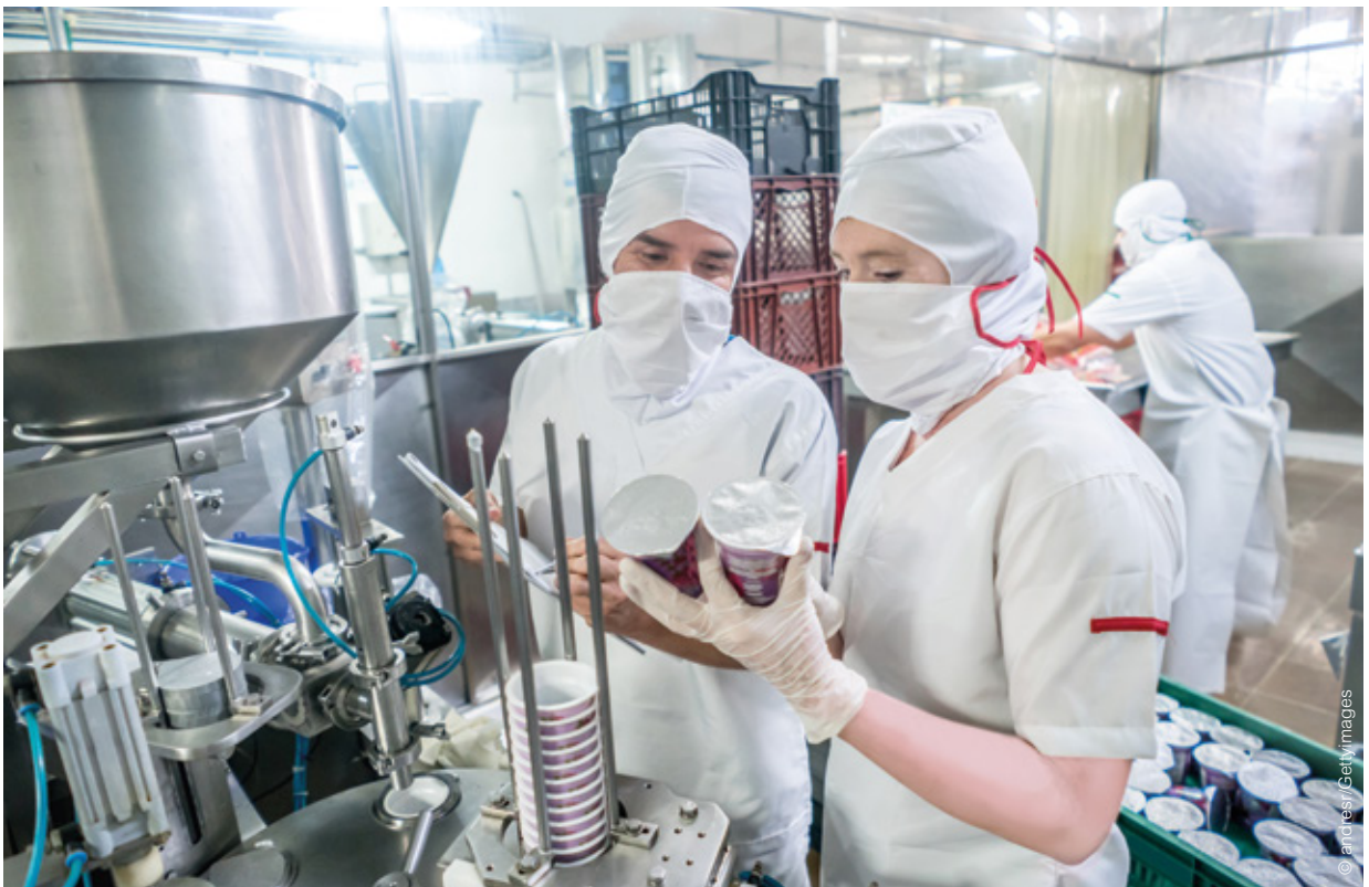
Abbildung 1: Eigenkontrollen helfen dabei gesundheitliche Gefahren, die von Lebensmitteln ausgehen können, zu identifizieren und durch geeignete Maßnahmen zu beherrschen.

Gemäß europäischem Lebensmittelrecht sind primär die LebensmittelunternehmerInnen zur Gewährleistung der Lebensmittelsicherheit verpflichtet. Dazu müssen die Unternehmen auf allen Stufen der Lebensmittelkette (von der Primärproduktion über Herstellung, Verarbeitung, Lagerung, Transport bis zur/m EndverbraucherIn) integrierte Managementsysteme für die Lebensmittelsicherheit etablieren, die mögliche Risiken für die menschliche Gesundheit eliminieren oder zumindest auf ein akzeptables Maß reduzieren. Die ISO 22000 beschreibt den Aufbau und Umfang von Managementsystemen für die Lebensmittelsicherheit. Als wesentliche Komponenten gelten in diesem Zusammenhang eine gute Hygienepraxis (GHP), eine gute Herstellungspraxis (GMP), ein betriebliches Eigenkontrollsystem zur